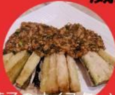
茄子のオイスターソース