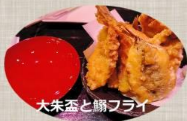
大朱盃と鰯フライ