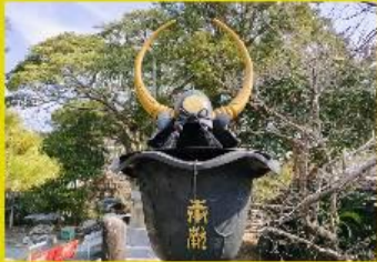
水牛の兜の手洗い