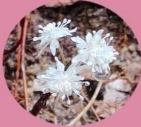
春の妖精(セリバオウレン)