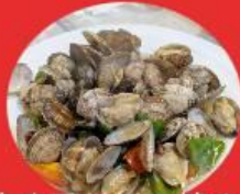
生きアサリの炒め