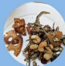
いりこ、ゴマと豆類の炒めもの(手作り)