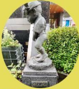
タイトル「すんまっせん」