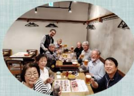
二日市食堂ともすけ