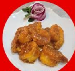
大海老のチリソース