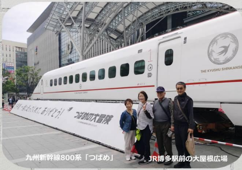
九州新幹線800系「つばめ」