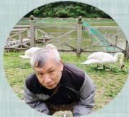
後ろの白鳥の親ではありません